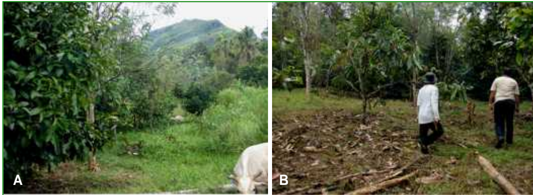
Gambar 2. Kondisi tempat penelitian dilaksanakan. Panel A kondisi lapangan dengan latar belakang perbukitan dan panel B, kondisi di dalam kebun percobaan.