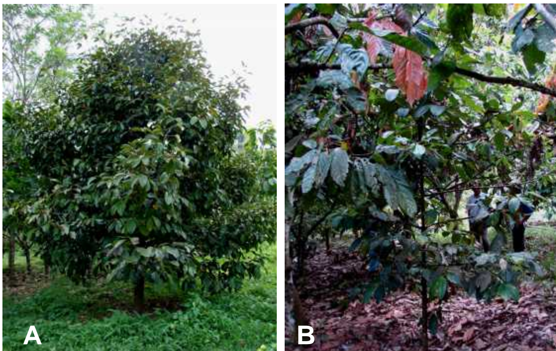
Gambar 3. Tanaman manggis yang tumbuh baik di sekitar bagian utara sebelah luar (A) dan tanaman manggis yang tumbuh di bagian dalam sebelah selatan (B).